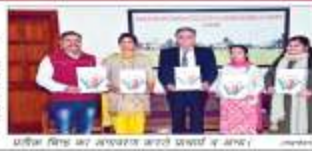
कार्यक्रम में अलग-अलग क्षेत्रों की महिलाओं को सम्मानित किया गया।

अंतराष्ट्रीय महिला दिवस पर प्रतीक चिह्न का अनावरण किया गया। कार्यक्रम में अलग-अलग क्षेत्रों की महिलाओं को सम्मानित किया गया।