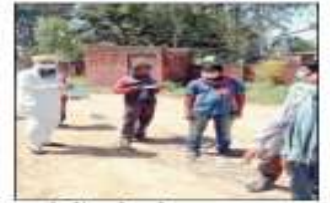
लोगों को भोजन व मास्क बांटते राधा-कुष्ण बाल आश्रम के सदस्य। (धर्मवीर)

नारायणगढ़, 8 अप्रैल (धर्मवीर) : कोरोना-19 के चलते जिला युवा शक्ति संगठन, समाजसेवी संस्था (राधा-कुष्ण बाल आश्रम) द्वारा लगभग 60 प्रवासी मजदूरों को खाना खिलाया गया।