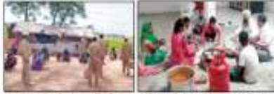
ग्रामीणों ने खाद्य सामग्री को सौंपी खाद्य सामग्री की वार्षिक रिपोर्ट में बताया है।