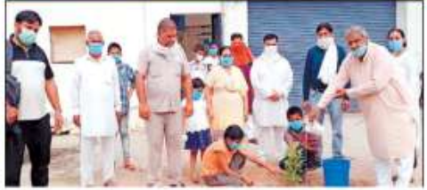
पौधारोपण करते गण्यमान्यजन।