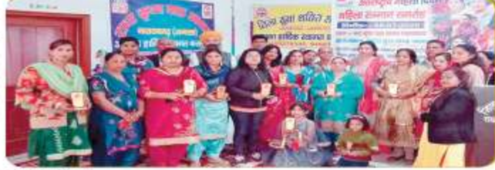
कार्यक्रम में महिलाओं को सम्मानित किया गया।

महिला दिवस कार्यक्रम में अलग-अलग क्षेत्रों की महिलाओं को सम्मानित किया गया। कार्यक्रम में अलग-अलग क्षेत्रों की महिलाओं को सम्मानित किया गया।