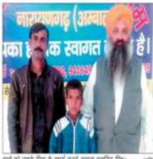
बच्चे को उसके पिता के मुकदमा के बाद आश्रम में लाया।