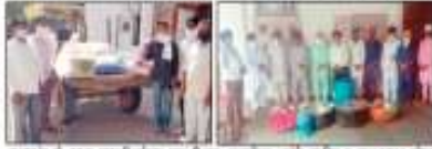
ग्रामीणों ने खाद्य सामग्री को सौंपी खाद्य सामग्री की वार्षिक रिपोर्ट में बताया है।

नारायणगढ़, 5 अप्रैल (धर्मवीर) : कोविड-19 के चलते ग्रामीणों को खाद्य सामग्री की आवश्यकता बढ़ गई है। जिला युवा शक्ति संगठन ने ग्रामीणों को सौंपी खाद्य सामग्री की वार्षिक रिपोर्ट में बताया है।